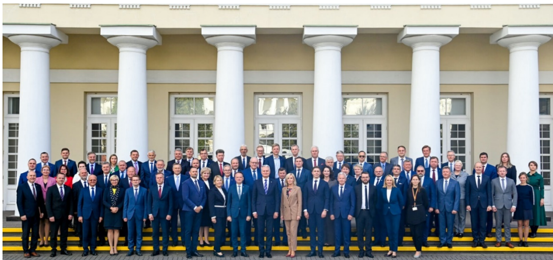
Lietuvos regionų forumo dalyviai

Meras kartu su kitais Lietuvos savivaldybių asociacijos posėdžio dalyviais aptarė Prezidento teikiamas Fiskalinės sutarties įgyvendinimo konstitucinio įstatymo pataisas. Šios pataisos savivaldybėms suteiktų didesnę finansinę savarankiškumą bei sukurtų galimybę investicijomis į projektus, finansuojamus Europos Sąjungos fondų, kitos tarptautinės finansinės paramos arba valstybės biudžeto lėšomis. Šias galimybes siūloma taikyti tiems projektams, kurie skirti prisitaikyti prie klimato kaitos, ją švelninti, taip pat skaitmeninti viešąjį sektorių ar ekonomiką.